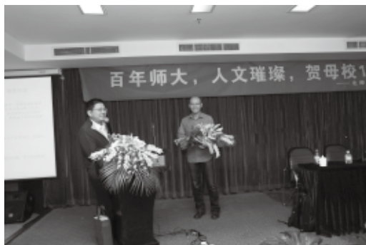
钟伟教授接受现场提问

钟老师从国际宏观、国内宏观的角度出发分析了目前的国际、国内经济形势。钟伟教授认为，中国需要加紧推进的经济改革有：收入分配改革、社会保障尤其是养老和教育改革，分税制改革、行业开放政策改革、农业生产承包责任制改革。钟伟教授认为，改革面对困境，阻力不小，但只有自上而下克服阻力，中国才会有一个美好的未来。