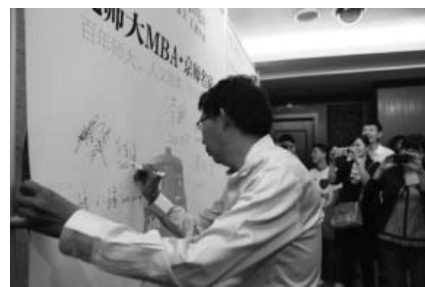
纪连海老师在“北师大MBA京师名家讲座”签名墙上留言

作为历史教学名家，纪连海老师认为“历史要求人学到的不仅仅是知识和学问，更要求人学到精神，有所感悟，有所体验。”纪连海老师在讲座中指出：历史和语言是一个国家的灵魂，历史是前人的经验和教训，若善加处理，为我所用，无论是个人、企业还是国家，都必将受益无穷。对于MBA学员，作为未来企业的管理者，必须立足于历史，运用历史的观点来看待现实问题，剖析问题的更深层次的原因和动机。以此为切入点，纪连海老师用诙谐幽默的语言与大家分享了改变他人生的“七个瞬间”。