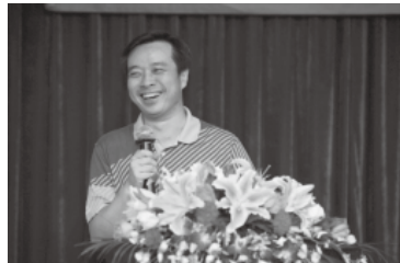
古代文学专家康震教授

2012年10月12日晚7点，北师大MBA教育中心邀请古代文学专家康震教授畅谈“古典诗词的人生境界”，意在与大家分享自己对古典文学的理解和感悟，通过诗词的风骨来解剖唐宋时期的风土人情，以及感受诗词名家对人生境遇中的种种态度。经管学院国际经济与贸易系仲鑫教授致欢迎辞。