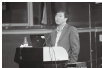
经济学名家李实教授

2012年10月24日晚7点，“北师大MBA 京师名家”系列讲座的第九场“中国掉入中等收入陷阱的风险”在新图书馆三层报告厅隆重举行，邀请经济学名家李实教授做题为“中国掉入中等收入陷阱的风险”的主题报告。本场讲座由经管学院院长助理狄承锋老师主持。